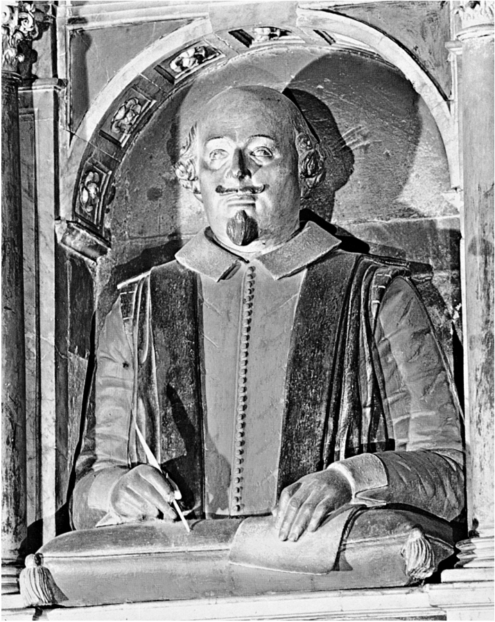
Grabbüste Shakespeares von Gheerart Janssen im Chor der Kirche zu Stratford